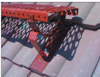
popis 2 Univerzální mezivlna č. 64 používaná s podpěrou stoupací plošiny č. 48 do všech druhů betonových krytin