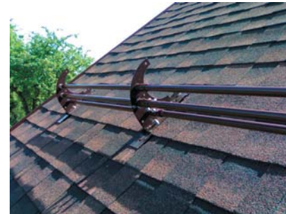
popis 12 Sněhový zachtávač křídlo č. 18 používaný do střešní šindelové krytiny s použitím tyče pod č. 28