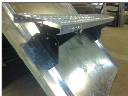
popis 1 Podpěra roštu č. 79 používaná jen na drážkové krytiny s nosností 120 kg při rozpětí 100 cm