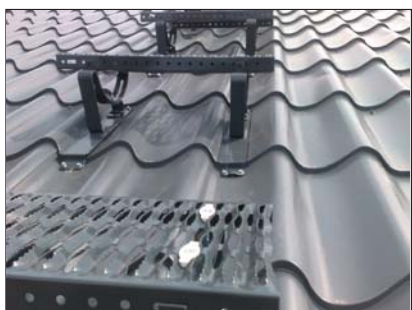
popis 4 Univerzální vlna č. 71 používaná pro stoupací plošinu č. 48 na plechové krytiny typu Lindab, Ruukki,...