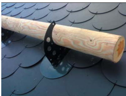
popis 11 Sněhový zachtávač křídlo č. 18 používaný do střešní krytiny Cembit bobrovka s univerzální plotnou