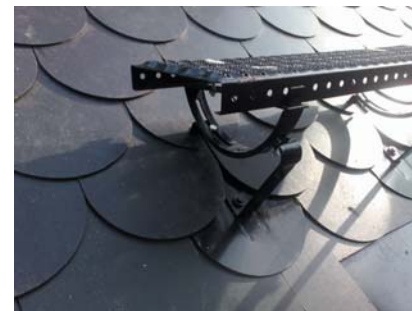
popis 3 Univerzální vlna č. 39 používaná pro stoupací plošinu č. 48 na hladké krytiny typu Cembrit