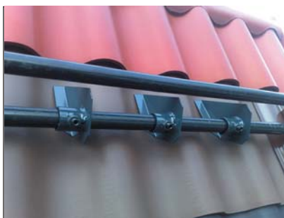
popis 8 Sněhový rozražeč používaný pro vlny A5, B8 najdete ho pod č. 77