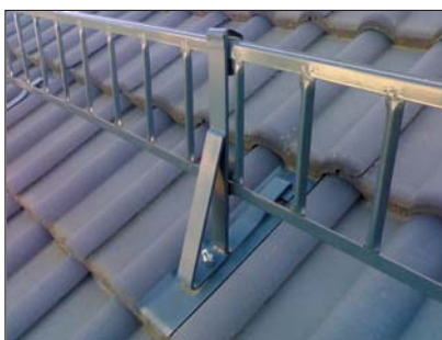
popis 5 Držák pro žebříček č. 31 používaný na univerzální mezivlnu č. 64 do všech druhů betonových krytin.