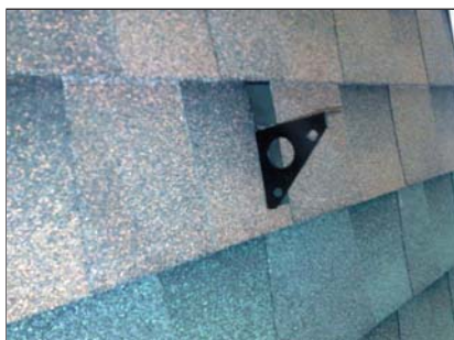
popis 10 Sněhový rozražeč (nos). Používaný do hladké krytiny Šindel.