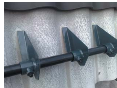
popis 9 Sněhový rozražeč používaný pro vlny A5, B8 najdete ho pod č. 77