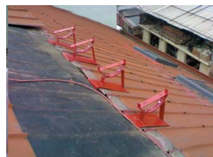
popis 6 Pohled na připravené podpěry pro stoupací plošinu.