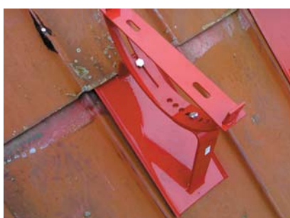
popis 8 Detailní pohled plotny s podpěrou po upevnění a zakrytí.