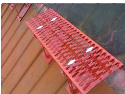
popis 11 Uchycení stoupací plošiny spojovacími materiály (olivami). Doporučujeme toto upevnění u kterého nedochází narušení povrchové úpravy stoupací plošiny.