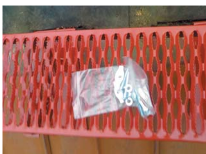
popis 10 Pohled na spojovací materiál, dodávaný ke každé plotně s podpěrou.