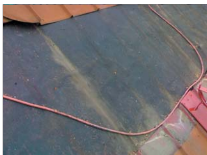
popis 2 Odkrytí krytiny pro montáž plotny pro stoupací plošinu.