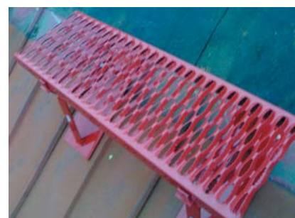
popis 9 Uložení stoupací plošiny do připravených podpěr.