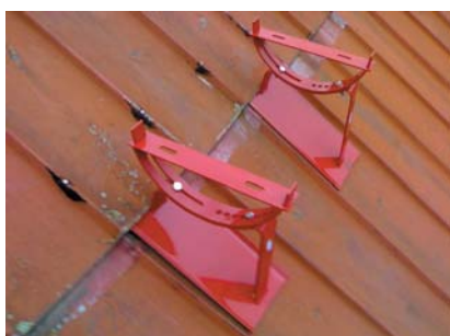
popis 7 Zakrytí podpěr krytinou do původního stavu.