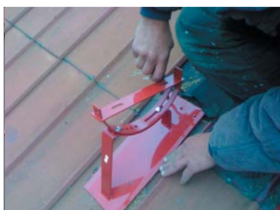
popis 5 Přišroubování plotny s třemi vruty k střešnímu plášti.