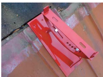
popis 4 Uložení plotny do připravené drážky