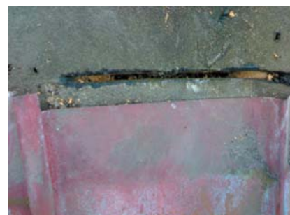
popis 3 Proříznutí drážky pro plotnu - pokud nevychází mezera v dřevěném záklopu (bedněni)