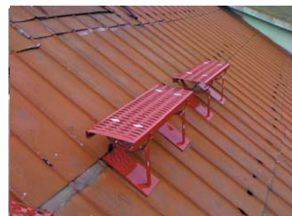
popis 12 Konečný pohled na namontovanou stoupací plošinu.