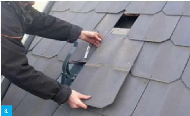
8. Dále vložíme další obdélník vedle toho, který jsme montovali předtím.