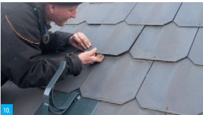
10. Nakonec vložíme poslední chybějící vláknocementový obdélník a nasadíme ho na vichrovou sponu, kterou opět ohneme směrem dolů. V žádném případě tento obdélník již dále nepřibíjíme, protože by byly hřebíky nekryté a zatékalo by.