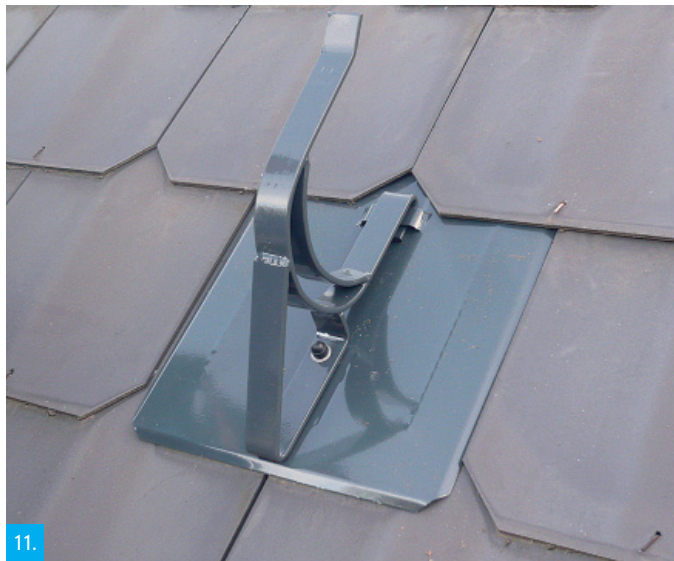
11. Pohled na kompletní nainstalovaný obdélník s držákem kulatiny a krytkou hlavy šroubu na centrálním vrutu.