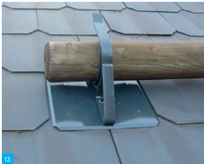
12. Tentýž držák, tentokrát s již nasazenou kulatinou o průměru 120 mm.