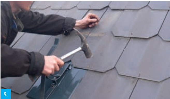
9. Obdélník přibijeme jedním hřebíkem a zajistíme dole vichrovou sponou.